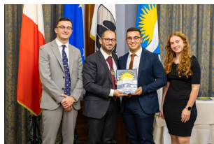
SERATA TA' ĠIEH IN-NADUR U RIKONOXXIMENTI Locality Honour Ceremony