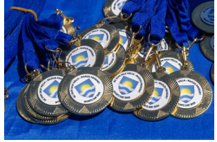
SPORTS DAY 2025