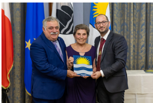
SERATA TA' ĠIEH IN-NADUR U RIKONOXXIMENTI Locality Honour Ceremony