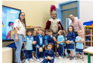
FESTA TA' SAN MARTIN 2024 St. Martin Feast