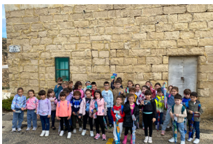
HARGA GHAT-TFAL TAL-PRIMARJA Kids' Outing