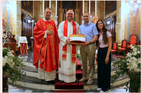
PREŻENTAZZJONI TA' TERHA GHALL-ARTALI TAL-ĠNUB New Decorative Cloths for Nadur Parish Altars