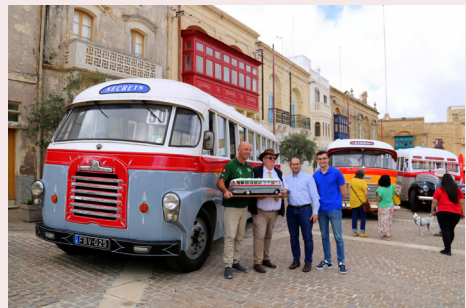
XOW TAL-KAROZZI TAL-LINJA ANTIKI FIL-PJAZZA Old Buses Show at Square