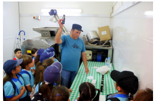
ŻJARA EDUKATTIVA GHAND RAMLA VALLEY Visit to Ramla Valley