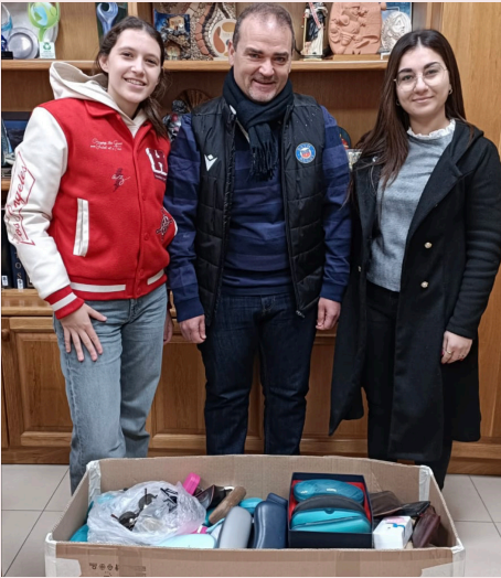
INIZZJATTIVA TA' ĠBIR TA' NUĊĊALIJIET GHAL KLINIKA FIL-GUATEMALA Eye Glasses collected for Guatemala Clinic