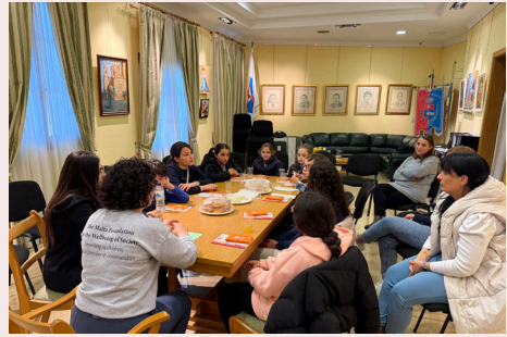
IFFURMAT IL-KUNSILL TAT-TFAL FIN-NADUR WARA TANT SNIN Formation of Nadur Kids Council