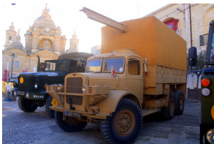
XOW TAL-VETTURI MILITARI Military Vehicles Show