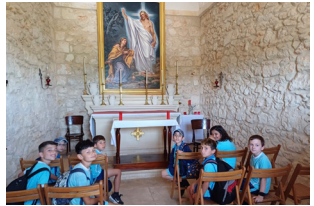
HARĠA GHAL-YEAR 5 F'MALTA Yr5 Outing in Malta