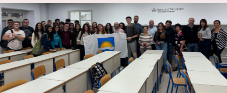
LAQGHA TAS-SINDKU MAL-ISTUDENTI NADURIN FIS-6TH FORM Mayor meeting 6th Form Students