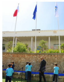
INVESTMENT F'ARBLI ĠODDA FIL-GRAWND TAL-ISKOLA New Flag Poles