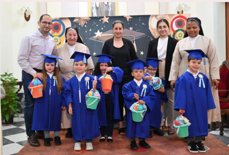
L-AHHAR ĠURNATA TAL-ISKOLA TAS-SORIJJIET FRANĠISKANI FIN-NADUR Last Day of Classes at St. Francis School